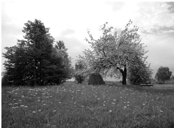
Kritinė temperatūra žydintiems sodams - 4-5 laipsniai šalčio.

Panašu, kad iki vakarykštės dienos rytinės gegužės šalnos didesnės žalos nepadarė. Pasak „Anykštos“ pašnekovų, kol kas šalnis nekrito žemiau nei 4-5 laipsnių kritinės ribos.