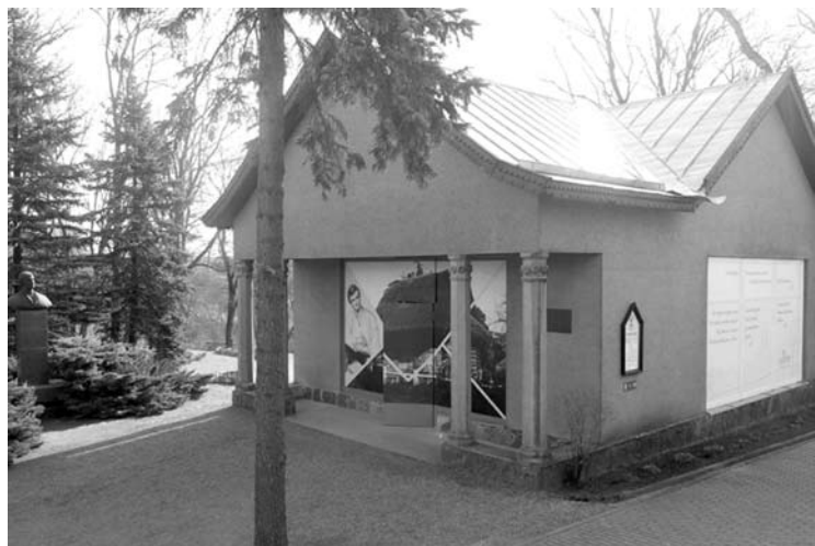
Ant Antano Baranausko klėtelės iškabintos instaliacijos sulaukė kritiškos visuomenės reakcijos.