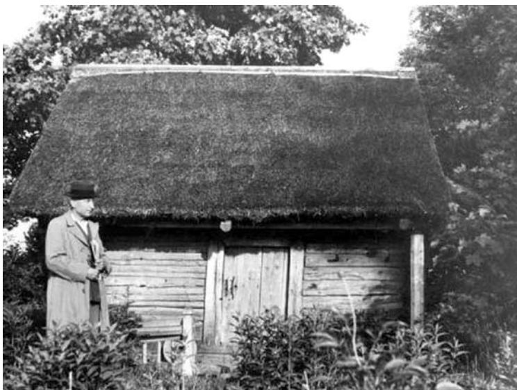
Rašytojas Antanas Vienuolis – Žukauskas 1949 m. prie poeto, vyskupo Antano Baranausko klėtelės.

Seniausias šalies memorialinis muziejus per tą laiką pasikeitė neatpažįstamai – su Anykščių krašto klasiko gyvenimu muziejininkai kviečia susipažinti ne tik žvelgiant į senovines relikvijas, bet ir į mobiliųjų telefonų ekranus.