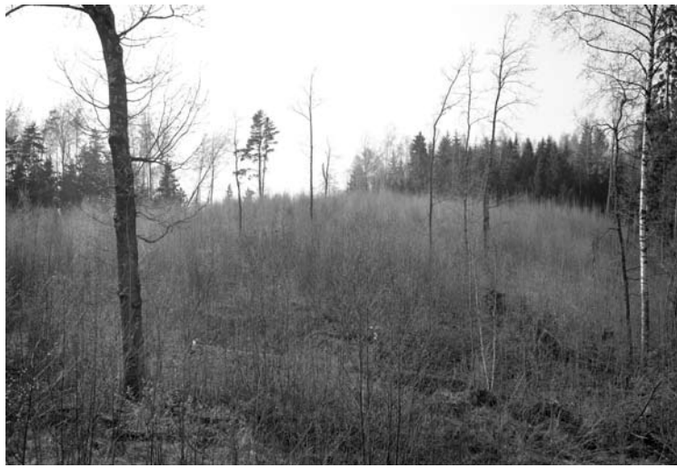
Privačių ir valstybinių miškų valdytojai gali kreiptis paramos stichinės nelaimės pažeistam miškui atkurti.